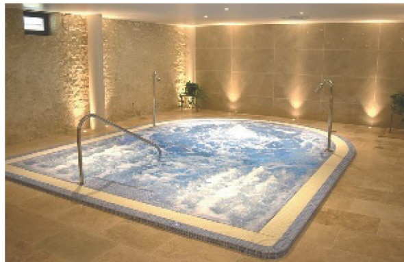
Hôtel Château des Vigiers

Installé dans un bâtiment classé Monument Historique, le nouvel espace bien-être avec piscine intérieure et équipement haut de gamme, veut apporter une expérience wellness immersive adaptée aux objectifs de chacun. Des appareils de haute technologie permettent